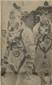
Practicamente des Traje

E astronautonan americano Virgil "Gus" Grissom (na robes) y John Young, a woe-de capta anba e grabaco aki, durante un apêrtico den